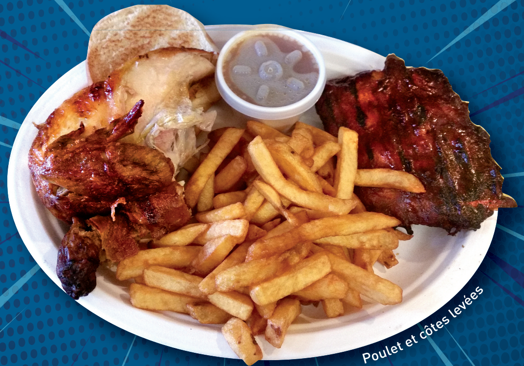
Poulet et côtes levées